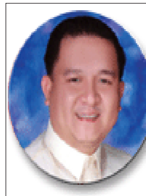
Mayor Doy Leachon

Iginawad ang mga nasabing parangal sa pagdiriwang ng ika-18 taong