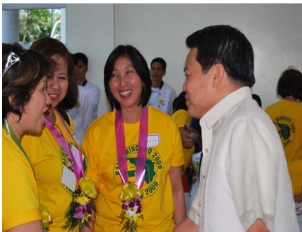
KAUSAP ni Gov. Arnan ang ilang kababaihang kabilang sa "Balik-Mindoro '09"